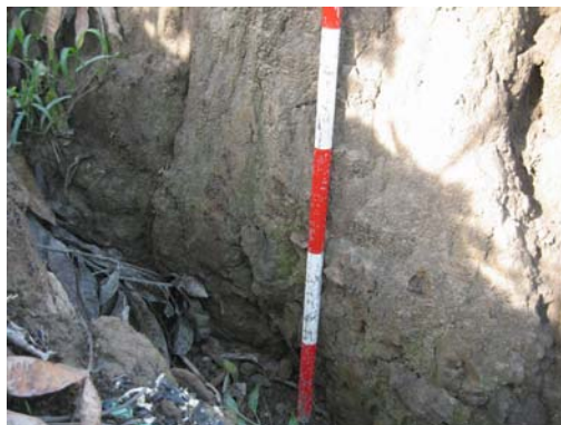
圖說：文化層內夾雜有橙色夾砂陶片