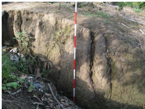
圖說：侵蝕溝切開地層露出文化層堆積